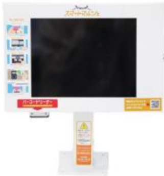
スマートマルシェ 通常端末