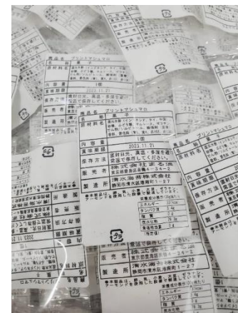
◆ 食品表示 (6点表示)