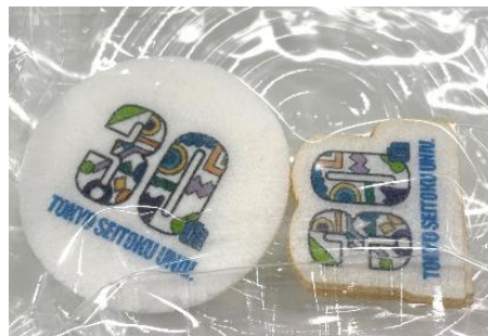
◆ モナカ ◆ 型抜きモナカ